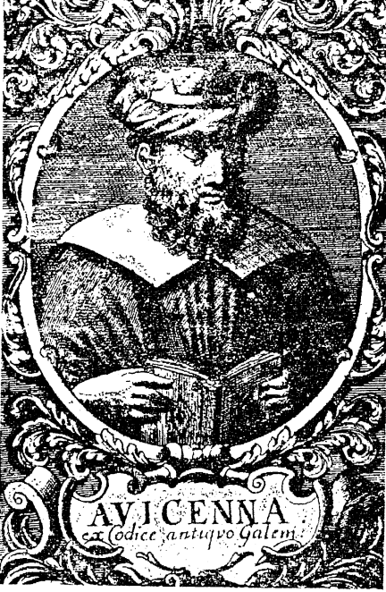
صورة قديمة لابن سينا وردت في بعض الكتب المطبوعة بأوروبا