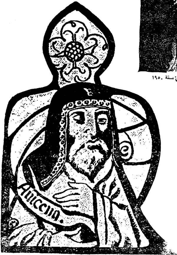
صورة قديمة لابن سينا على زجاج ملون في نافذة إحدى الكنائس