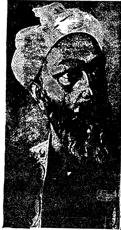
Painting by M. Kheikhmammedey