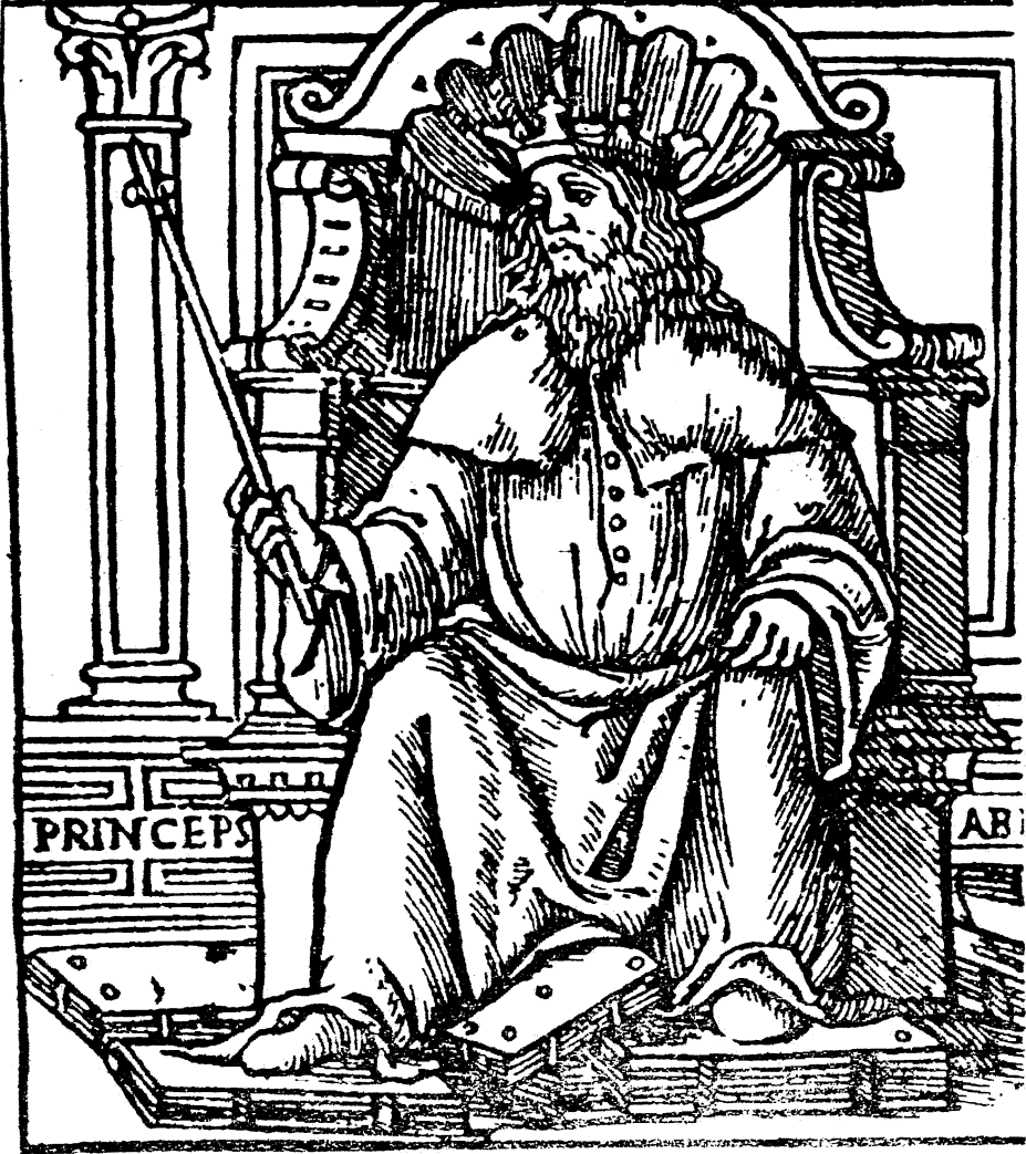
صورة وردت في الطبعة اللاتينية لكتاب القانون في السنوات ١٥٢٠ - ١٥٢٢ تمثل ابن سينا أمير الأطباء جالسا على منبر الأستاذية