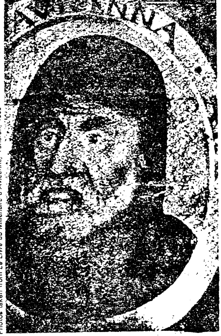
صورة كشفت سنة ١٩٥٠ على جدار مكتبة بوديليان بأوكسفورد كانت مغطاة بطبق من الجص

Photos taken from Le Livre de Millénaire d'Avicenne , Teheran, 1983