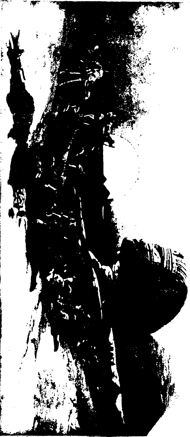
جيزده اصام و ابو الهول