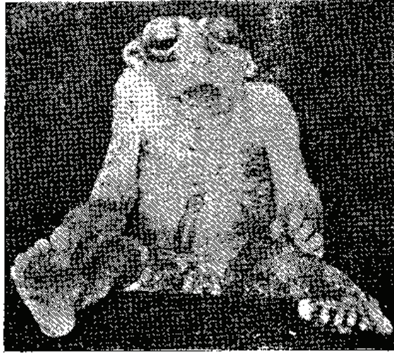
صباح ربابا ایلہ مجنون برولدہنک وقتسز دوشن اچویہوی چوغنی چارخانہ قولکسیونندن

مرسم حفظ الصومسی : بوموسمدہ اک چوق قورقیلاجق بورون وکوکس نزلہسنہ طوتیلمدن . تری ایکن