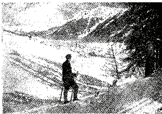
باشہ مملکتلرہ قیش

روز کارہ قارشنی طورمقلہ درحال اوشورز . نزلہ دیوب کچمہ ملی در . چوق ایشلر آچار . برقچ قیش اول استانبولہ اسپانیول نزلہسی دینان انفولنزا صانغینک نہ قدر کچی وتوانا آدملری آرامزدن آیدرینی خاطرلر دن چیقما .