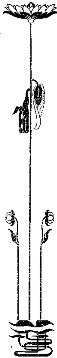
د صحنی موزه قولک سیرتستان ۴