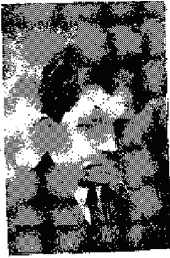
ملال اخضر کاتب عمومی ذوقتور فخرالربین کریم بک

جو جق تربیہ سندہ تعقیب ایدیلہ جک یولاردن ، طبیعی وسیکرلی چوجقلردن بحث ایتدکن صوکره ، وراثت قانونلرنده بخنون عائله ، سبکرلی و کثول پرستارک ازدواجلردن چاریبق و بخنون محصوللر میدانه چیقدیقنی نابولر کوستره دک ایضاح ایتشددر . مملکت مزده ذکی و ابدال چوجقلرک عینی مکتبلرده تحصیل کوردیکنی ، بوکی ابدال چوجقلرک صنفلرنده متبادیاً ابقاقلمق صورتیه تحصیللری یاریده برادقلرینی . وطنه نافع اولامادقلرینی عریض وعمیق آکلاتدقن صوکره استانبول ، آقره و دیگر غلبه لقی شهرلرده تجربی روحیات