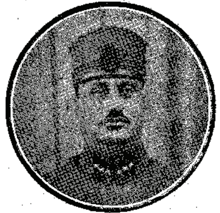
ملال اخضر رئیس تالیسی میر آوی عاطف بک

موزینانک تازه قره جکرندن چیقاریلور . ایچله جک زمان ایولدن مارته قیدر اولان صوغوق موسملرددر . آلاجق مقدار شخصک بنیه سنه ، نحماله کوره دیشیر . کونده برچوربا قاشیغندن باشلا یاراق کیتدکجه آرتدیریلور . اوچ یاشندن اعتباراً چوجقلر بک اعلا هضم ایدیه ییلیرلر . بالق یاغنی ایچمک ایچون اک موافق زمان صباح آچ قارنددر . اوزرینه قهوه آلی یاییلور . بوی پامایانلر تکلمده ویا بکدن برمدت اول آلمایدرلر . بالق یاغنی آلسدینی زمان کلن بولاتی عصی در . برمدت صوکره اسهال ویا بولاتی