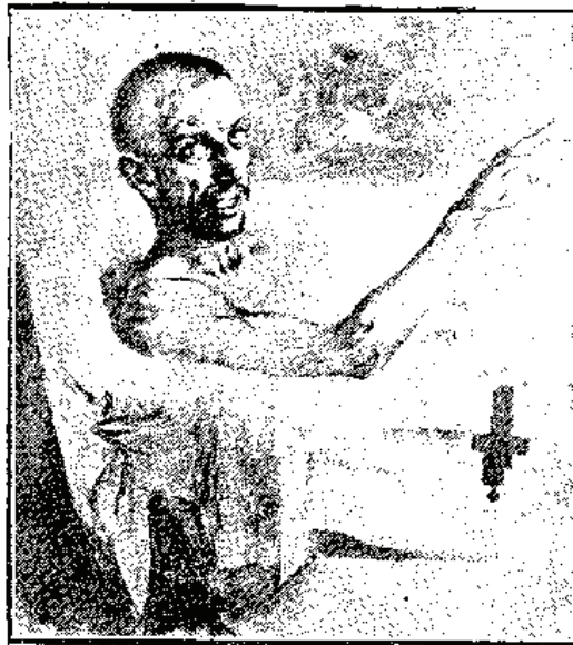
فرنکی جنتک آزعینانغی آنجی صیحا ق بایو آسکین ایدر .

بر عائله تربیه سی آلمادینغی ایچون بکی آیلدینغی حیاتک بوتون صویسزلقلرینی آز زمانده او کره نش ، هر آقشام بالقندن قازاندینغی ایچی بیه ویرمکه و عین زمانده غلطه فحش