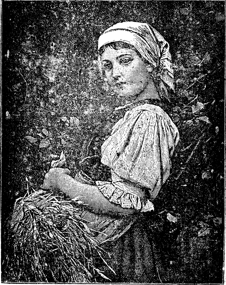
( تارلاده عودت )